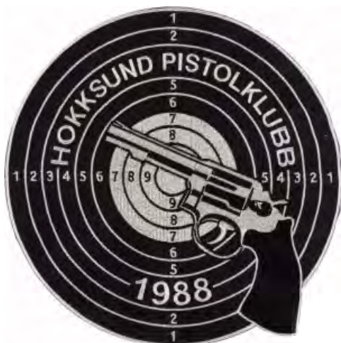
Sølv på Sort